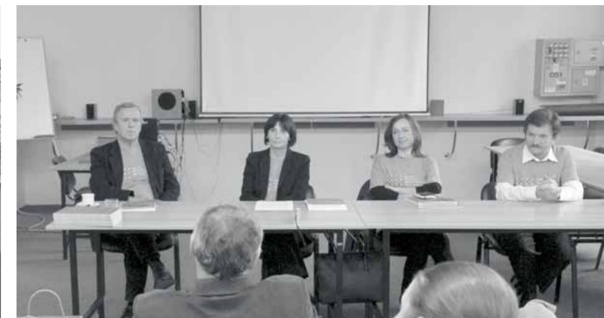
vedenie Fakulty architektúry STU na tlačovej besede

INFORMAČNÉ LISTY FAKULTY ARCHITEKTÚRY STU V BRATISLAVE # 2