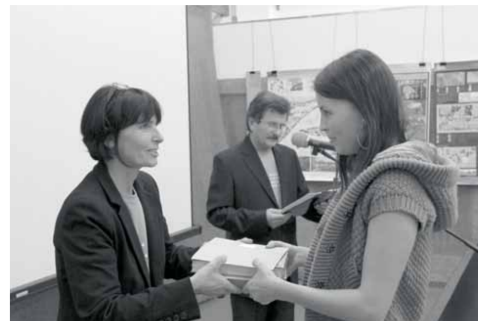
odovzdávanie Ceny dekana 2011